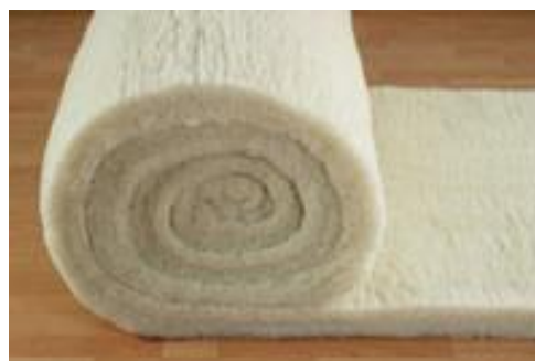
Stand: März 2010