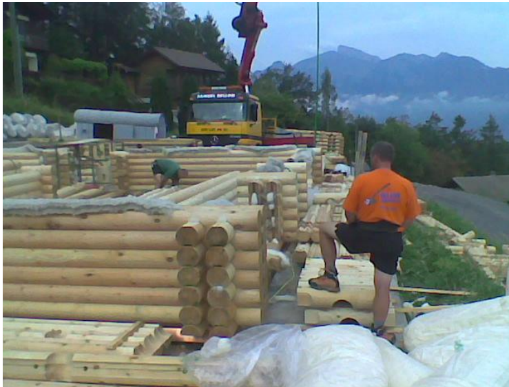
Bau des ersten MAHEDA-Duo-Round- Blockhauses in Torgon VS, Schweiz im Sommer 2009

Das fast fertig gestellte Niedrigenergie-Rundbohlen-Chalet hat ca. 135 qm Wohnfläche mit zusätzlich angebauter Garage und Heizungsraum. Es entspricht in seiner Ausführung den höchsten Anforderungen an den Wärmeschutz und wurde mit rein ökologischen Natur-Materialien erbaut: Massivholz und Schafwolle.